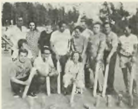
Helsingin inkerilaisea kyykanpelaajia alkukesasta Puotinharjun urheilukentalla.

Kyykkapeli (eli pualikkapeli ja poppipeli inkerilaisittain) kuuluu inkerilaisilla kansanpetinnepeleihin 'kuten rajakarjalaisillakin. Se on hyvin hauskaa pelia. Sits todistaa varmaan sekin, etta kesän kuluessa ilta illan jalkeen sits on pelaamassa pitkalle toistakymmenta miesta ja naista. Valista on pelattukin kandessa ryhmassas. Elokuun lopullakin all parikymmeta nuorta ja vanhempaa lyOmassa knikkaa. Kaikki Olemme olleet aloittelijoita. Olemme opetelleet