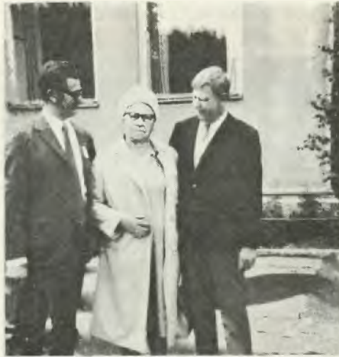
Mitiis sanot "kuoma" jos tehhai trehvit ensi juhannuksena taas? Kuva on erohetkesta Ore- bron kesajuhlilta.